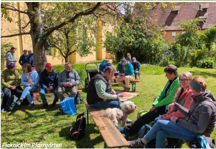
Picknick im Pfarrgarten