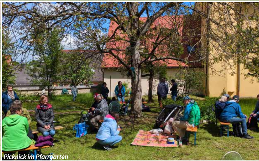
Picknick im Pfarrgarten

„Gerne wieder, das hat richtig Spaß gemacht!“ Das war die einhellige Meinung am Ende unserer ersten Pfarreiwanderung an Christi Himmelfahrt.