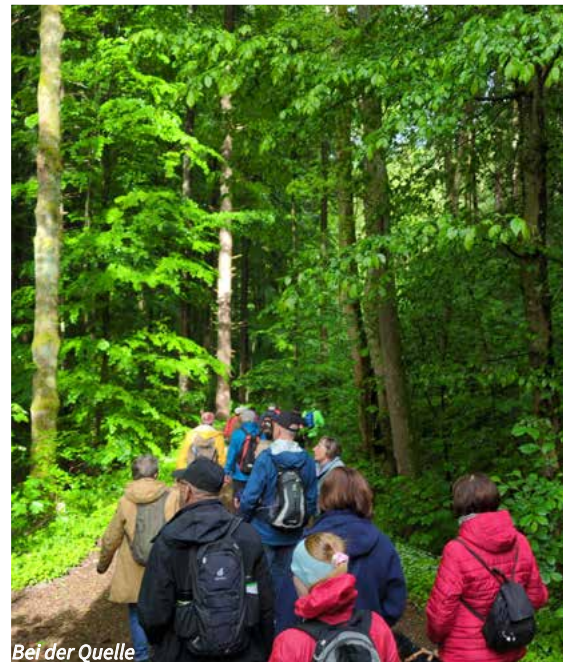
Bei der Quelle