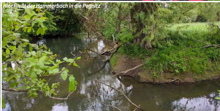
Hier fließt der Hammerbach in die Pegnitz