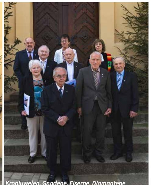
Kronjuwelen, Gnadene, Eiserne, Diamantene